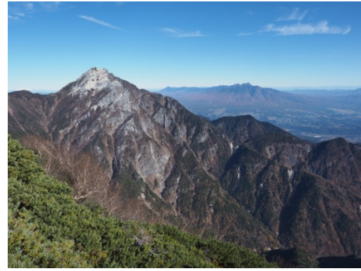
甲斐駒の奥にハヶ岳

早川尾根は行く人が少ない。岩稜と這松が混じる辺りで踏み跡が消えた。這松の細くて柔軟な根っこに足を乗せるとふらふらして、転ばないようにするのが精一杯。しかし大きなアップダウンは少なく、ずっと素敵な眺望が続いている。すれ違う人がほとんどいない極上の尾根道だ。もう少しで頂上という時、ふと顔を上げると正面に富士山のシルエットが目飛び込み、思わず歓声を上げた。