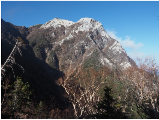
間近に眺める甲斐駒ヶ岳の摩利支天