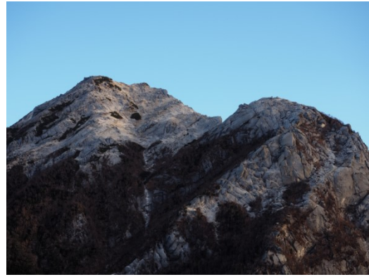
白い岩肌の甲斐駒ヶ岳頂上

15 時半ごろ小屋に戻り外のテーブルで宴会開始。やがて夕食。この小屋の名物は新鮮なお刺身。甲府の市場まで買出しに行っているそうだ。味噌汁には山で採れた珍しい濃い茶色の栗茸が入っている。ありがたく、おいしくいただいた。