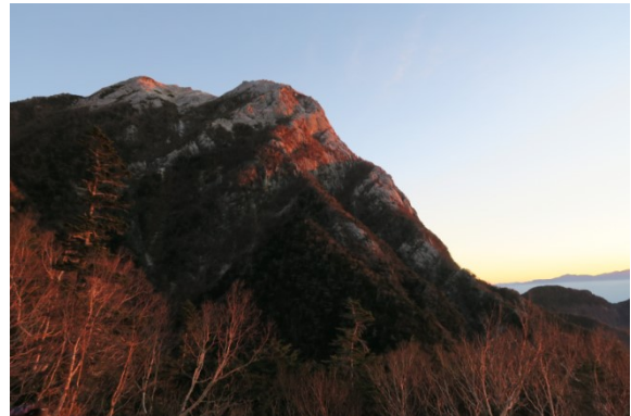
朝日に赤く染まる甲斐駒ヶ岳

翌朝 4 時起床、5 時過ぎに出発。仙水峠でご来光、ヘッドライトをしまい、いざ急登へ。ぐんぐん高度を上げ、右に紅葉の山肌に挟まれた伊那谷、中央アルプス、そして北アルプスが展開されていく。左は雲海の中に奥秩父。そして徐々にハヶ岳が姿を現し、視界が広がっていく。