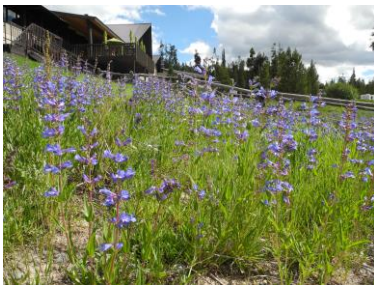
シグナルマウンテンロッジ付近