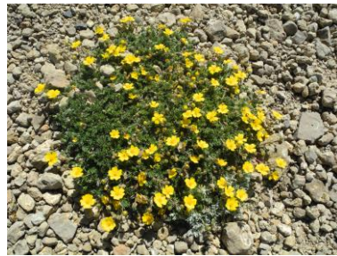
キジムシロ属 (トラム終着地)