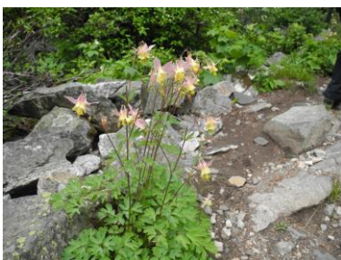
オダマキ (デスキャニオン)