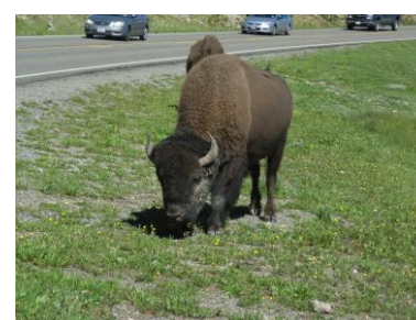
バイソン (イエローストーン)