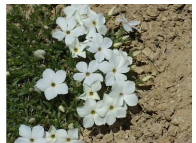
モスクャンピオン (トラム)