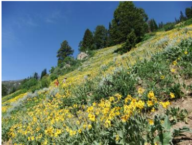
ゴールデンアスター ブラッドリー・タガード・ループ