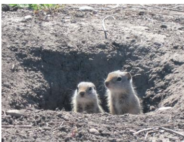
マーモット (キャンプ場付近)