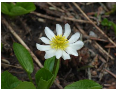
マーシュマリーゴールド (カスケードキャニオン 沢ぞい)