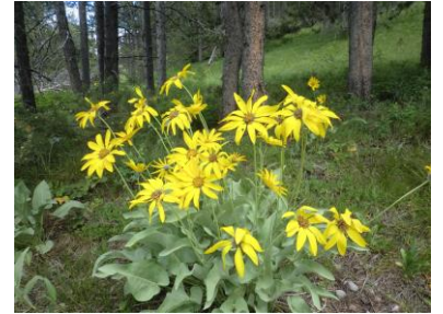
ゴールデン・アスター