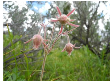
オールドマンズウィスカーズ 教会の庭 (バラ科)