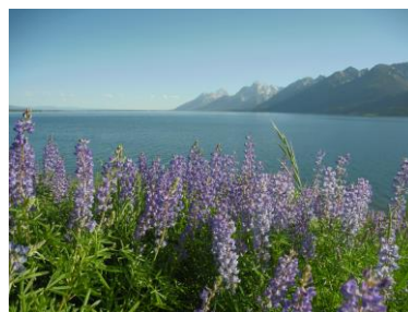
ルピナスとジャクソンレイク