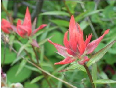
インディアンペイントブラシ (ワイオミング州の花)