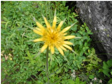
イエローサルシファイ (きく科)