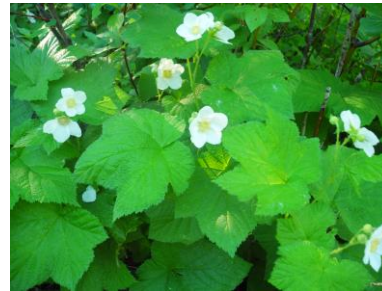
シンプルベリー (木イチゴ属)