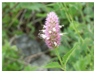
フィールド・ミント (デスキャニオン)