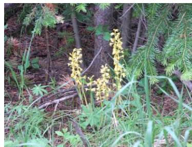
パイネドロップス