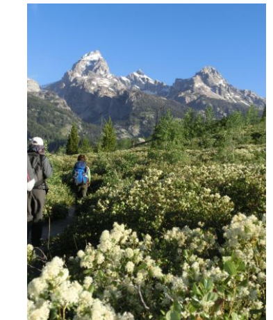
白い花の中に行く