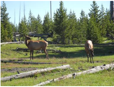
エルク (イエローストーン)