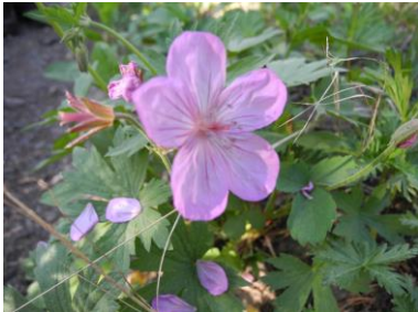
ジェラニューム (フウロ)