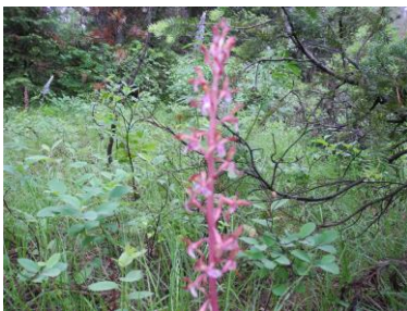
パイネドロップス (デスキャニオントレイル)