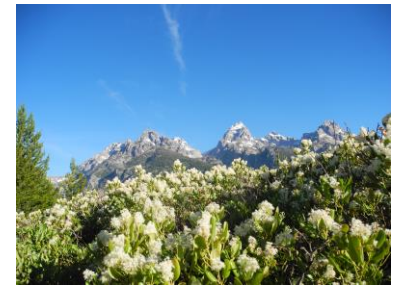
デスキャニオントレイル