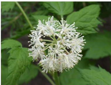
シモツケ? カラマツ?属