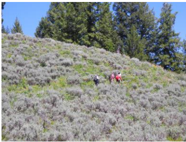
まだ咲かないラベンダーの丘に行く