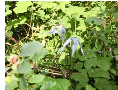
ブルー・クレマチス (カスケードキャニオントレイル)