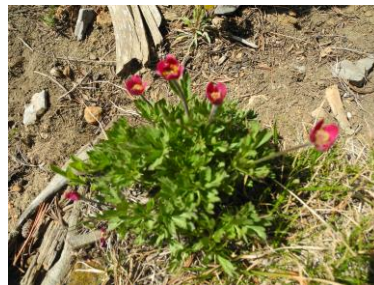
? (2950m) カスケードキャニオントレイル