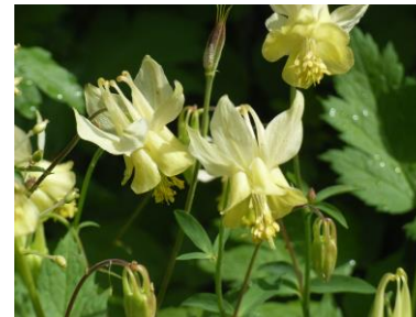
イエローオダマキ