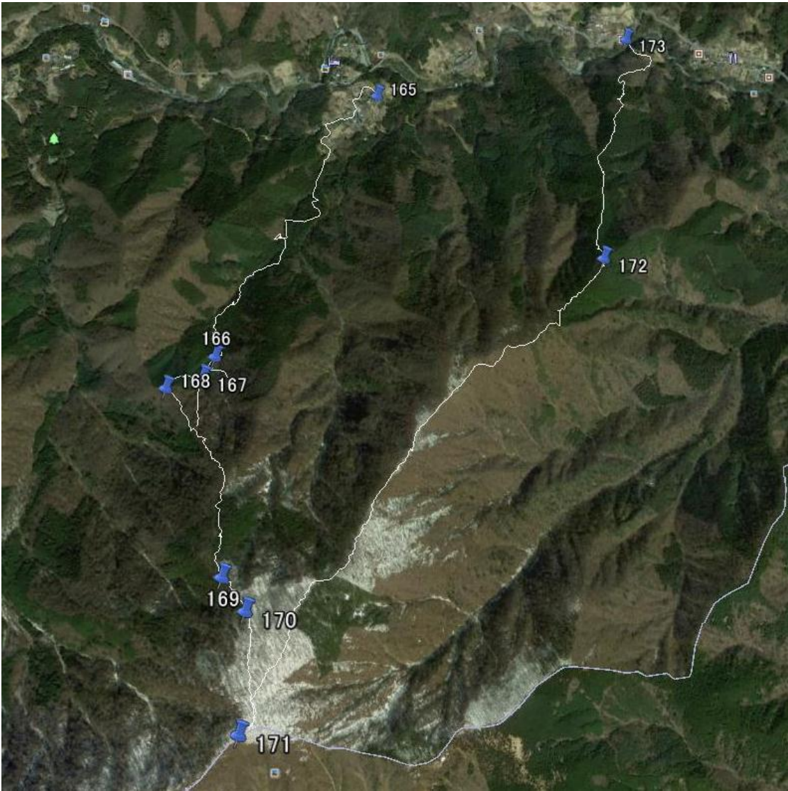
(平成 25 年 7 月 20 日 中道 記)