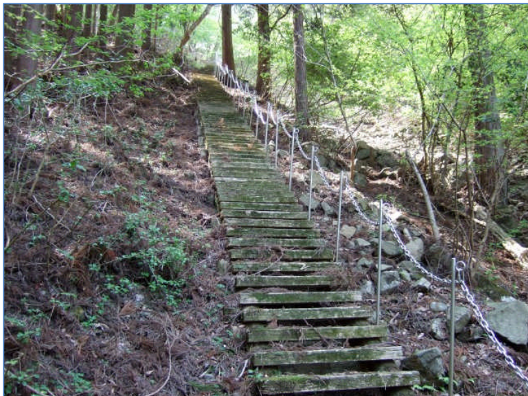
佐野峠への辛い登り。(13:13)