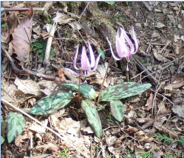
思親山の山頂が近づくと、 カタクリが群生していました。 まだ見頃でした。(14:19)