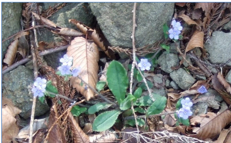
しかし、お花はたっぷり楽しめました。(13:25)