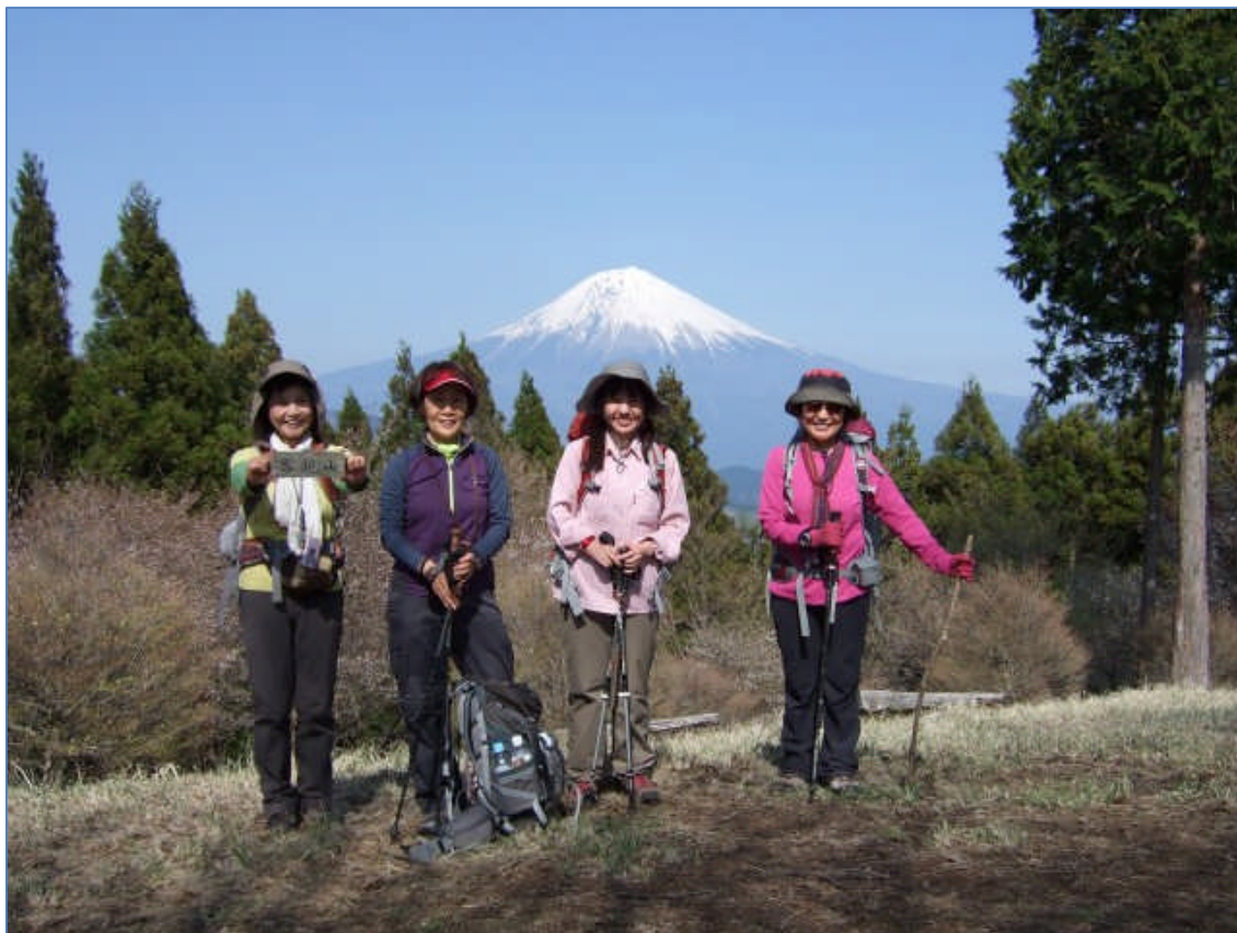
思親山の山頂にて。(14:47)