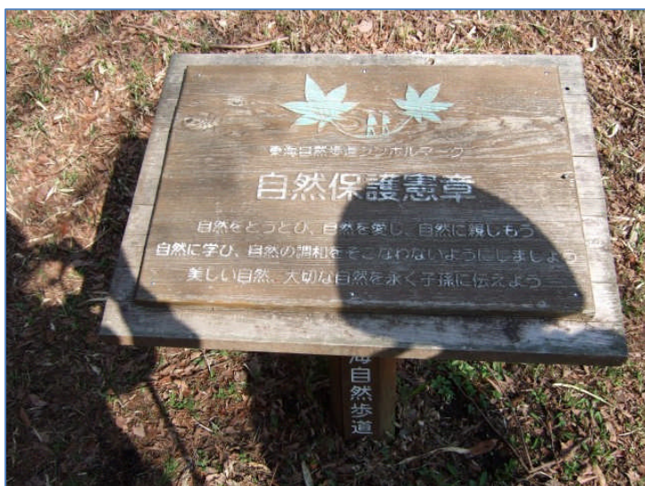
東海自然歩道のシンボルマーク(7:34) 初めて知ったかも。。