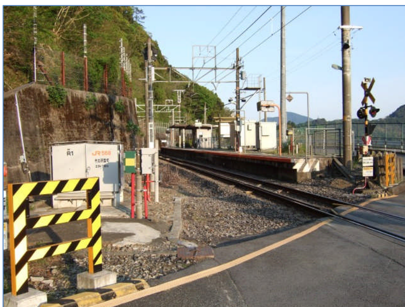
JR 身延線・井出駅は無人駅です。 東海自然歩道は、この踏切を渡って右へ向かいます。(県道 10 号を北西の方向) 1km 位先の富栄橋で富士川を渡り、更に国道 52 号(身延道)も越えて西へ進むこととなります。

ところで、井出駅到着は 17:05 でしたが、実は 17:02 発の富士駅行の電車があって、到着直前に行ってしまったのです。次の 18:08 発富士駅行まで約 1 時間、駅の回りやホームで過ごしました。