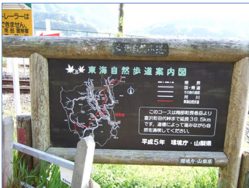
井出駅に到着。 踏切手前の案内板です。(17:05)