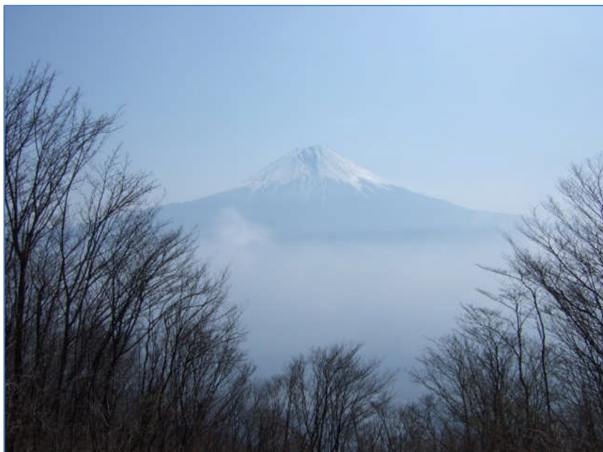
長者ヶ岳山頂にて (9:00)