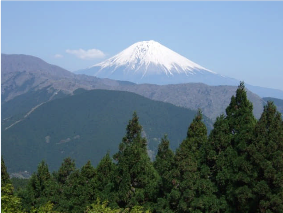
佐野峠からの富士山。 (13:41)