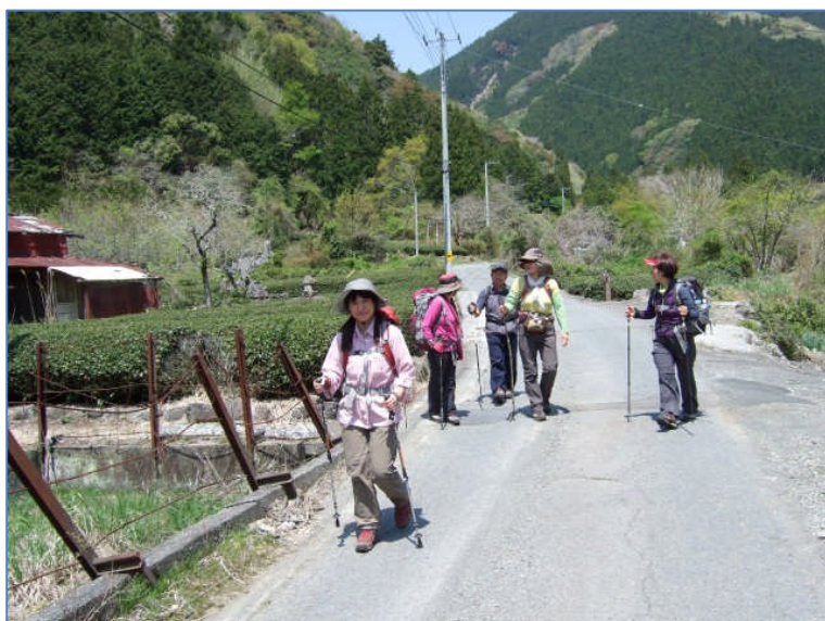
お茶畑の上佐野。(12:04) この少し手前で昼食にしました。

小生は気が付きませんでした、長者ヶ岳、 天子ヶ岳への登山口には通行止めの表示が あったとのこと。