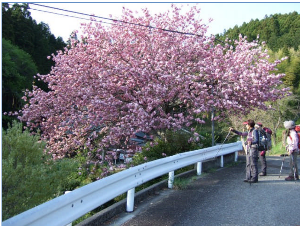
源立寺手前の八重桜。 満開でみごとでした。 (16:26)