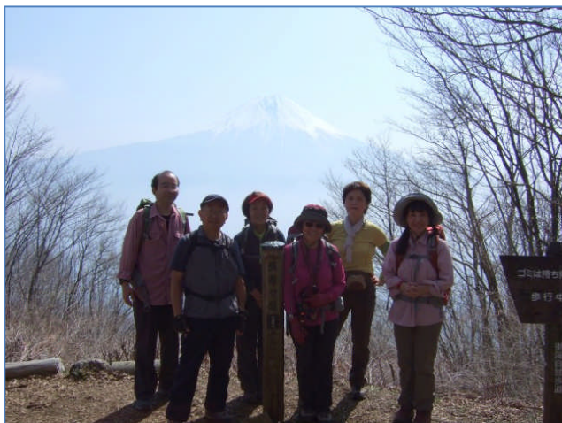
長者ヶ岳山頂にて(8:40)