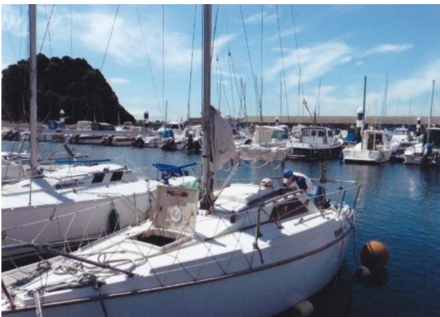
(三浦半島・三崎に係留している我が愛艇)

昔この大きさのヨットで太平洋を渡った人がいたが、どの世界でも冒険家とは人並み外れた偉才の持ち主で、我々の想像をはるかに超えるものだと思う。