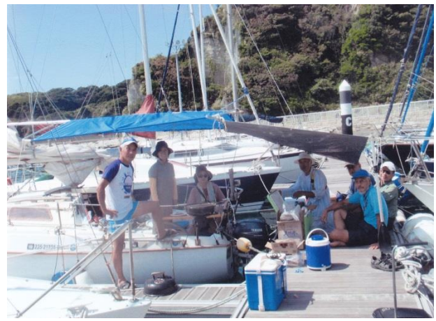
(ヨット遊びに来てくれた山なかまシリウスの仲間と)

自分の力量はどのくらいのものなのだろう。単独で伊豆諸島三宅島位までは行けるような気がする、新島までは二度行ったがその先は未到であった。長年の課題が残されていた。今年こそはと一念発起、というよりは来年はさらに困難になろうとの思いから大好きな山歩きも休み、この航海にかけたのだった。